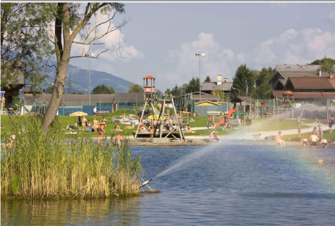
Freizeitzentrum "Hollidee" in Hollersbach